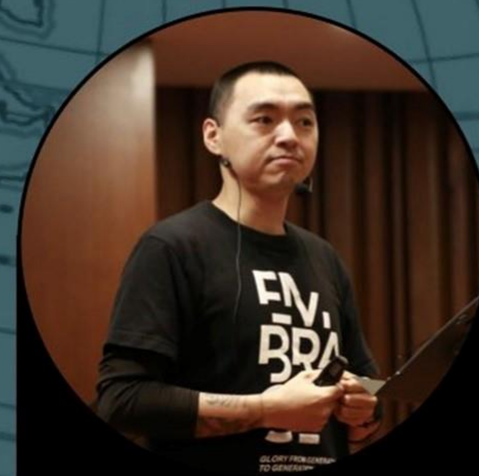
楊右任 弟兄 YU-JEN YANG