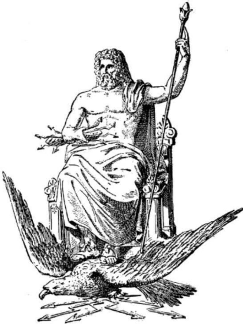
丟斯 (宙斯) Zeus